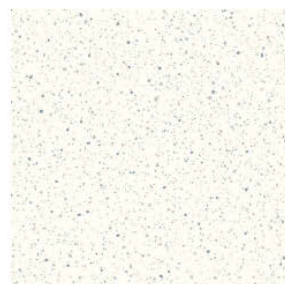
Tapet 105 Kök Vit-grå stänktapet Boråstapeter Johan 4513