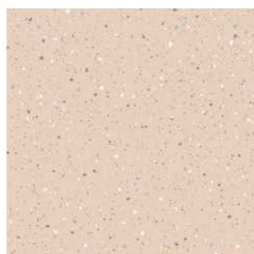
Tapet 103 Sängkammare Rosa stänktapet Boråstapeter Johan 4512